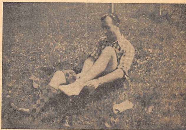
LE VAINQUEUR SATISFAIT.

Nous voilà installé au carrefour du Bois de Hal. Premier passage, un cycliste de l'endroit. Deuxième passage, une charrette, un cheval, une vache, le tout conduit par un homme. Il est 10 h. moins deux, déjà 20 minutes de retard et pas de Pégaseux. Emotion, un bruit de gra-